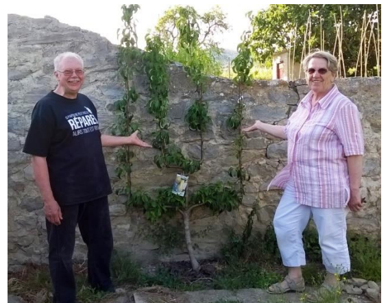
Le poirier de la paix, offert par SERVAS international